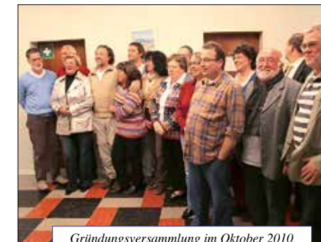
Gründungsversammlung im Oktober 2010