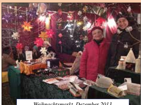
Weihnachtsmarkt, Dezember 2013