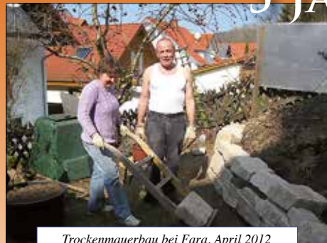
Trockenmauerbau bei Fara, April 2012