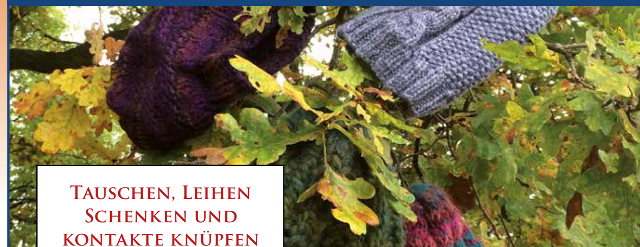
Wir tauschen Vieles, z.B. Selbstgestricktes, gegen Zeitgutschrift

NACHBARSCHAFTSHILFE + TAUSCHRING IM RAUM WETTERAU, MAIN-KINZIG, VOGELSBERG