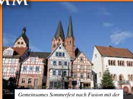
Gemeinsames Sommerfest nach Fusion mit der Vita-Tauschbörse Gelnhausen, August 2013