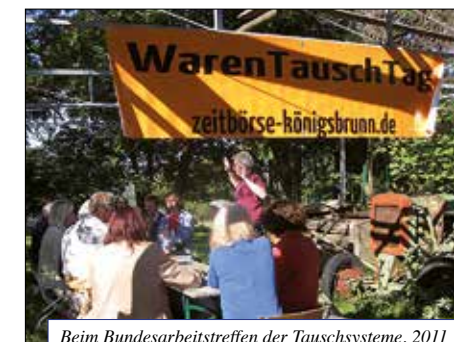
Beim Bundesarbeitertreffen der Tauschsysteme, 2011