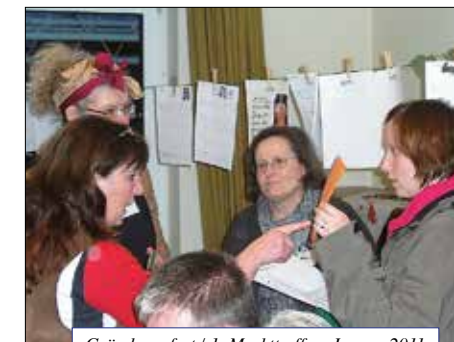
Gründungsfest / 1. Markttreffen, Januar 2011