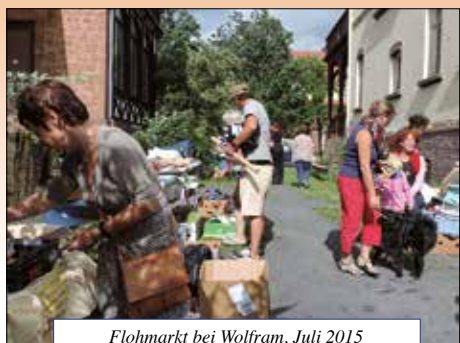
Flohmarkt bei Wolfram, Juli 2015